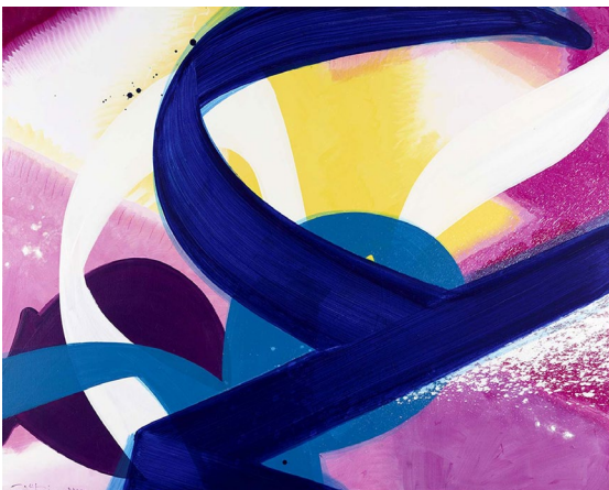
View 7 | 120 x 150 cm | Acrylic on canvas | Aatifi 2020